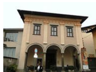
Chiesa di Santa Croce