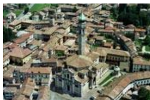
Basilica S. Maria Assunta

Ore 12,30 circa fine della visita partenza con le vetture per Songavazzo per pranzo al Ristorante Donna Rumma previsto per le 13/13,15