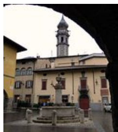
Palazzo del Salone