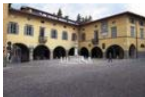
Palazzo del Vicario